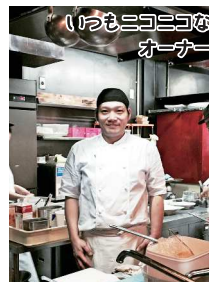
いつもニコニコのオーナー 私…実はチーズが苦手。パスタのチーズはもちろんのこと、前菜、デザート、そしてピザまでもチーズを抜いてくれました！（^v^）

他にも、ランチパーティー、ディナーパーティー、歓送迎会などなど季節のイタリア料理を囲んでワイワイ楽しめるプランが豊富。ぜひ行ってみてくださいね♪