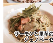
サーモンと里芋のシメノベゼ