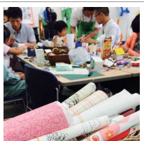
壁紙の破材を使った工作教室