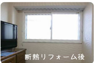
断熱リフォーム後